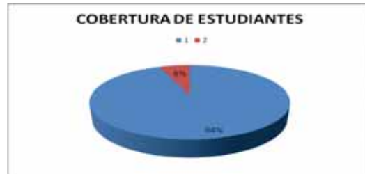
(FIGURA N° 2)

so de nuevos estudiantes siendo así que para el año 2011, se cuenta con 18.300 estudiantes, de los cuales la gran mayoría pertenecen a los estratos 1, 2 y 3 6 .