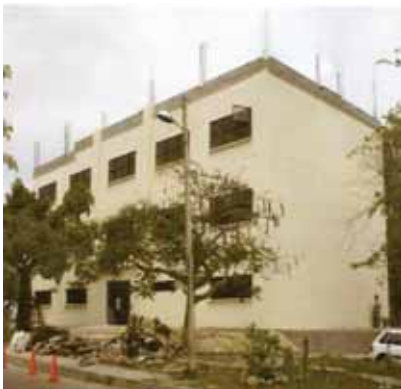
(Centro de Tecnología Multimedia)

Con los recursos de las estampillas igualmente se ha generado una cobertura mayor en el ingre-