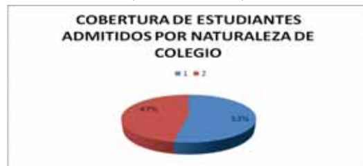
(FIGURA N° 3)

La mayoría de los estudiantes admitidos en la Universidad de Cartagena, han sido estudiantes graduados de colegios públicos, beneficiando de esta manera a la población de escasos recursos que pretenden salir adelante mediante una profesión. 7