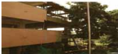
(Sede Piedra de Bolívar)